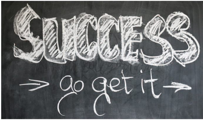
PAR JOCELYNE LAPOINTE-BOURGEOIS