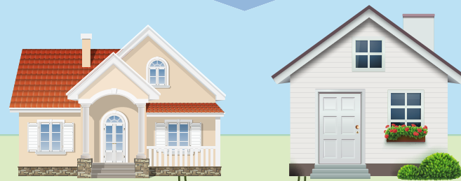
Système de traitement tertiaire avec déphosphatation

Les eaux usées des deux résidences isolées sont acheminées vers un seul système de traitement tertiaire avec déphosphatation certifié par le Bureau de normalisation du Québec.